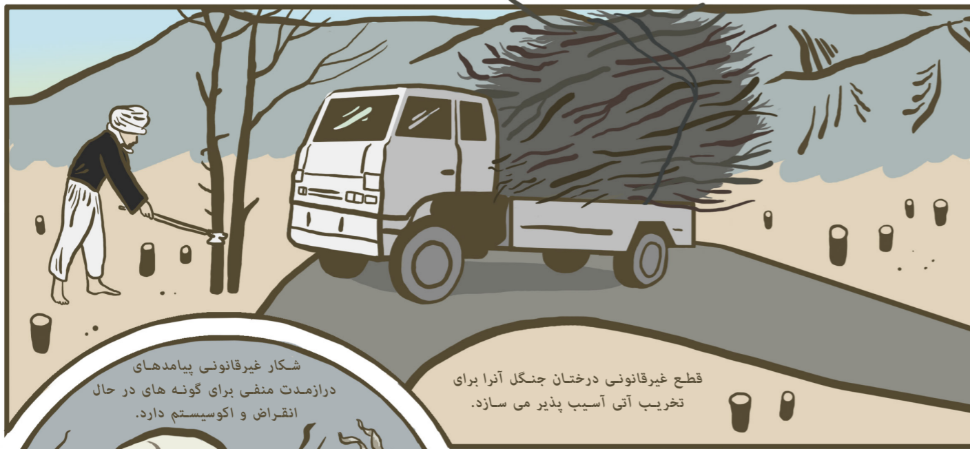
قطع غیرقانونی درختان جنگل آنها برای تخریب آبی آسیب پذیر می سازد.