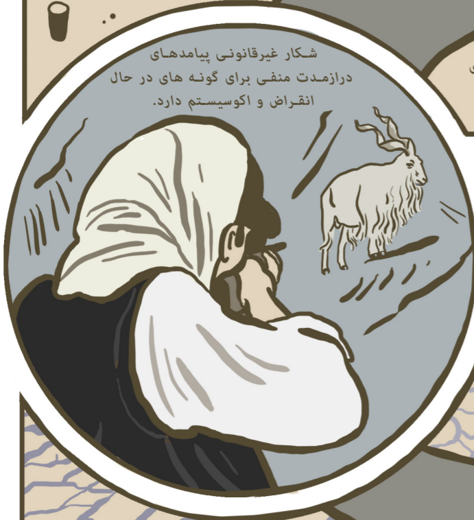
شکار غیرقانونی پیامدهای درازمدت منفی برای گونه های در حال انقراض و اکوسیستم دارد.