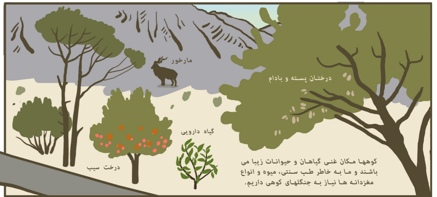
درختان پسته و بادام