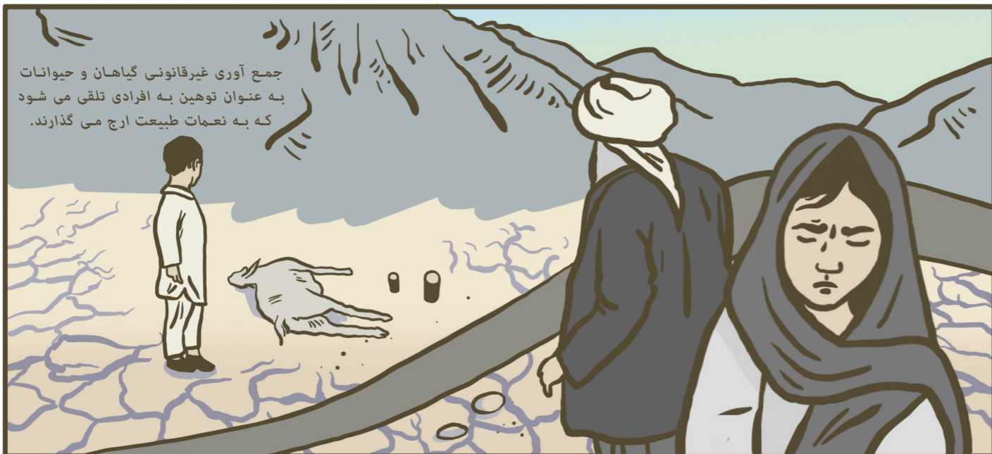
جمع آوری غیرقانونی گیاهان و حیوانات به عنوان توهین به افرادی تلقی می شود که به نعمات طبیعت ارجح می گذارند.