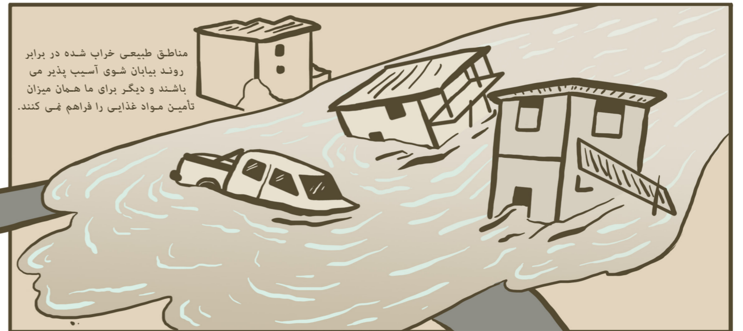
مناطق طبیعی خراب شده در برابر روند بیابان شوی آسیب پذیر می باشند و دیگر برای ما همان میزان تأمین مواد غذایی را فراهم نمی کنند.